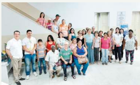
Evangelismo na Prefeitura - 06/01/2020